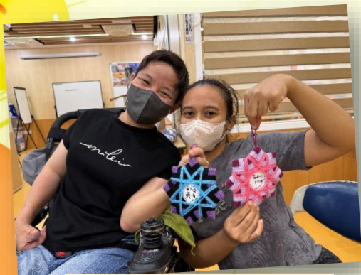
織織復織織：星之花