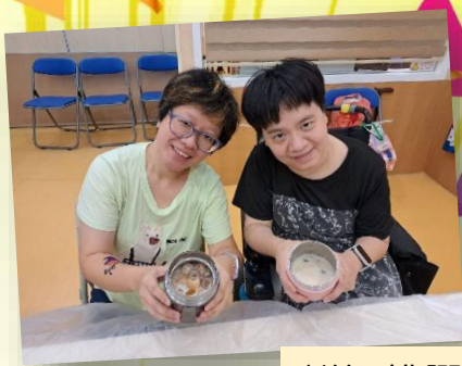
鮮奶桃膠桂圓糖水