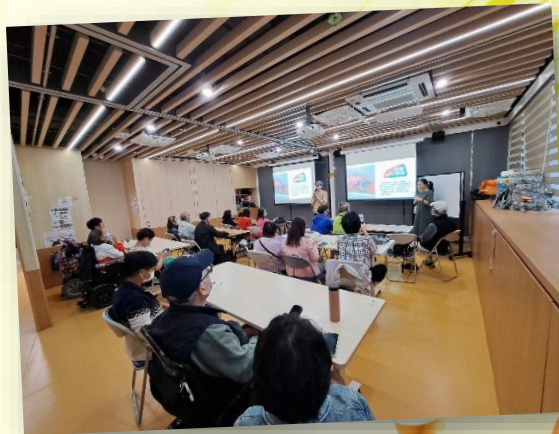
「智灣遊」手機應用程式工作坊