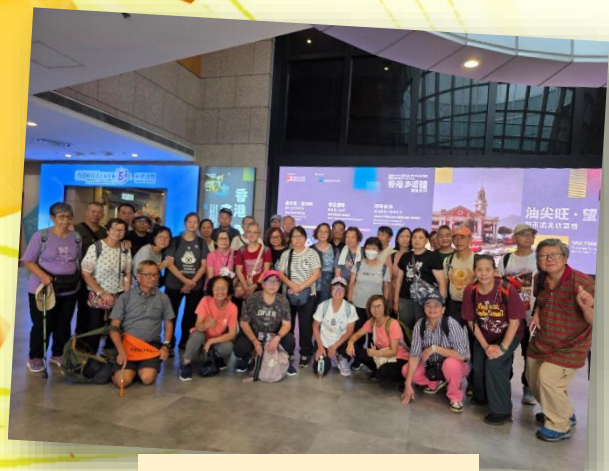
認識國安暨馬灣遊